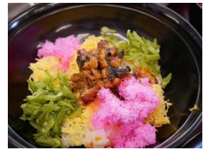
こちらは、刻みの形態です

うなぎ丼、ナスとカボチャの煮物、お吸い物、そして、すいかです。うなぎ丼は彩り豊に食欲をそそる様に意識しました。皆さん美味しくいただきました。残暑にも負けず！乗り越えます！